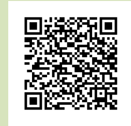
ลิงค์ตรงเข้าระบบแอปพลิเคชัน รายงานยาขาดแคลน