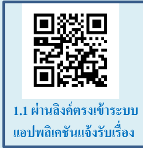
1.1 ผ่านลิงค์ตรงเข้าระบบแอปพลิเคชันแจ้งรับเรื่อง

จาก บริษัทยา โรงพยาบาล ราชวิทยาลัย/สมาคม/ชมรมแพทย์