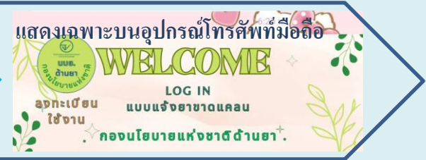
1.2 ผ่านบัญชี Line official นบย. ติดตามยาขาด

ขั้นตอนใช้งานแอปพลิเคชันแจ้งรับเรื่องยาขาดแคลน