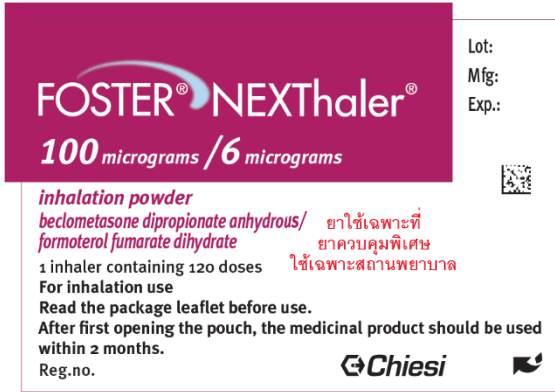
Pag. 1 (FRONT)