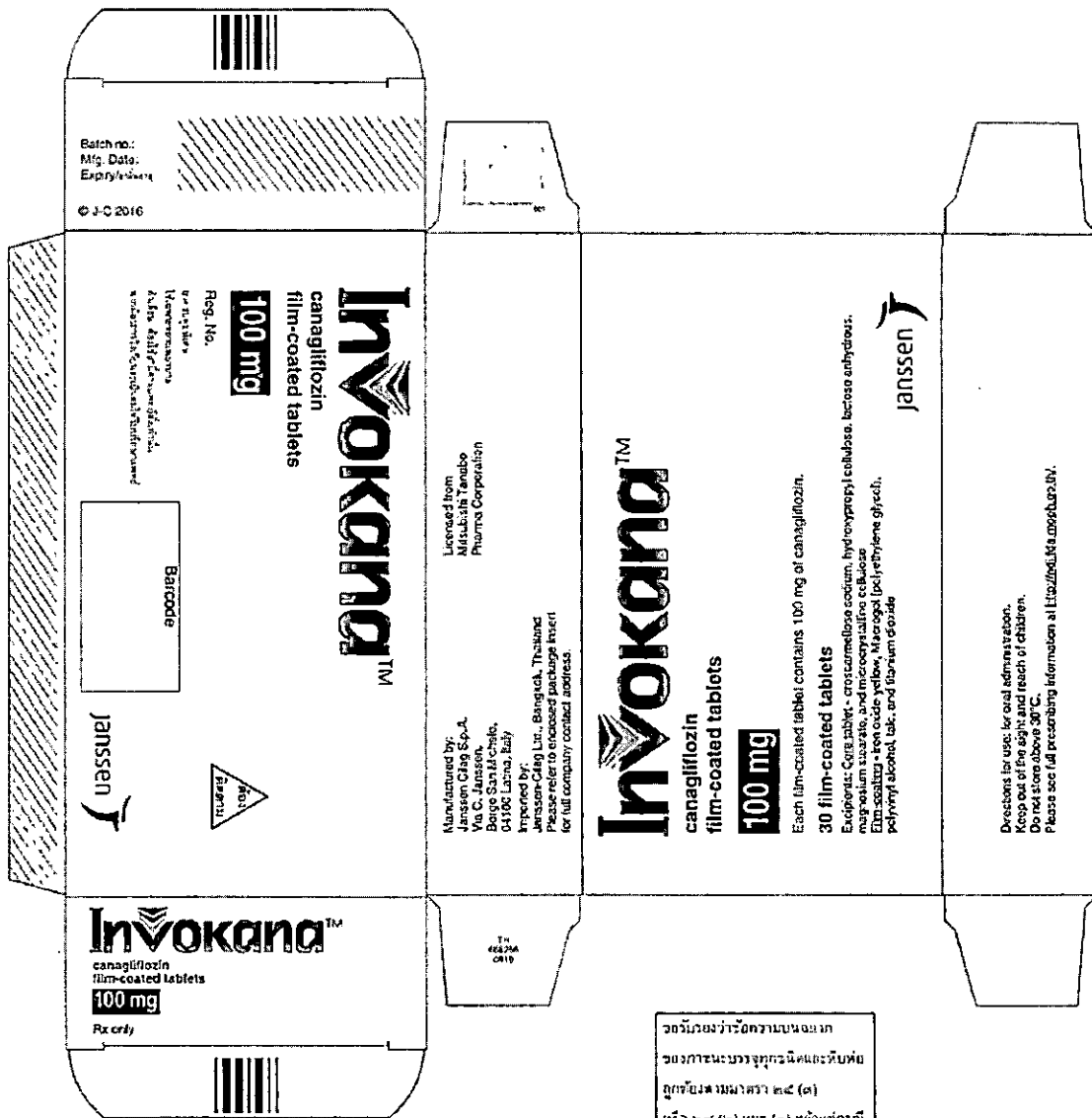
รูปภาพ ข้อความบนฉลากกล่องบรรจุยา Invokana ขนาด 100 mg

ฉลากยามีจำนวน 100 แผ่น จำนวนยาบรรจุกล่องมี 30 (๓๐) แผ่น หรือ ๒๘ (๒๘) และ (๓) แผ่นต่อกล่อง