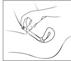
รูปแสดงวิธีการสอดหลอดยาเข้าช่องคลอด